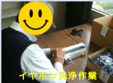
イヤホン洗浄作業

通所に不安がある方などのために、どなたでも参加できる作業として施設内作業を準備しています！メインは『イヤホン洗浄作業』でスターフライヤー様からの受託作業となっており、他にも『自動車部品のワックス塗り作業』や『インデックス作成、製本作業』などがあります☆