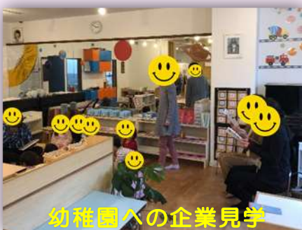
幼稚園への企業見学

就職を目指す方には、就労移行支援へのキャリアアップも見据えての『企業見学』や『短期の職場体験実習』も実施しています！他にも『パソコン教室』や『園芸作業』などを通して職業準備性を高めるための支援を行っています！