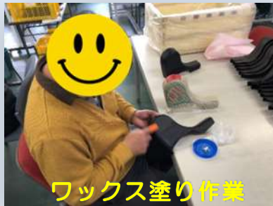
ワックス塗り作業