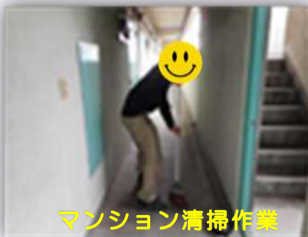
マンション清掃作業

就労に向けた体力づくりのために施設外作業があり、『マンション清掃作業』や『駐車場清掃作業』、『民家の除草作業』などの清掃業務や、リサイクル工場での『遊技機の解体作業』などの直接的な労働を通して就労への自信を付けてもらいます！