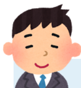
旅行好きの A さん

毎月旅行プランを立てています。これまで、長崎・広島・鹿児島について調べられていて、今月は愛媛に取り組んでいます。交通機関や名産、観光名所、障害者割引についても調べてくださるので、有益な情報満載です。