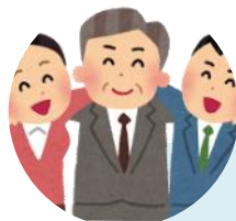
ブラタモリ好きが集まったグループ

毎月旅行プランを立てています。これまで、長崎・広島・鹿児島について調べられていて、今月は愛媛に取り組んでいます。交通機関や名産、観光名所、障害者割引についても調べてくださるので、有益な情報満載です。