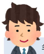
羊毛フェルトにハマった B さん

みなさんのアンケートからブラタモリ好きが多いことが分かり、グループを組んでもらいました。どんな番組なのか、どんなところが魅力なのかなどをグループで話し合い発表してもらいました。